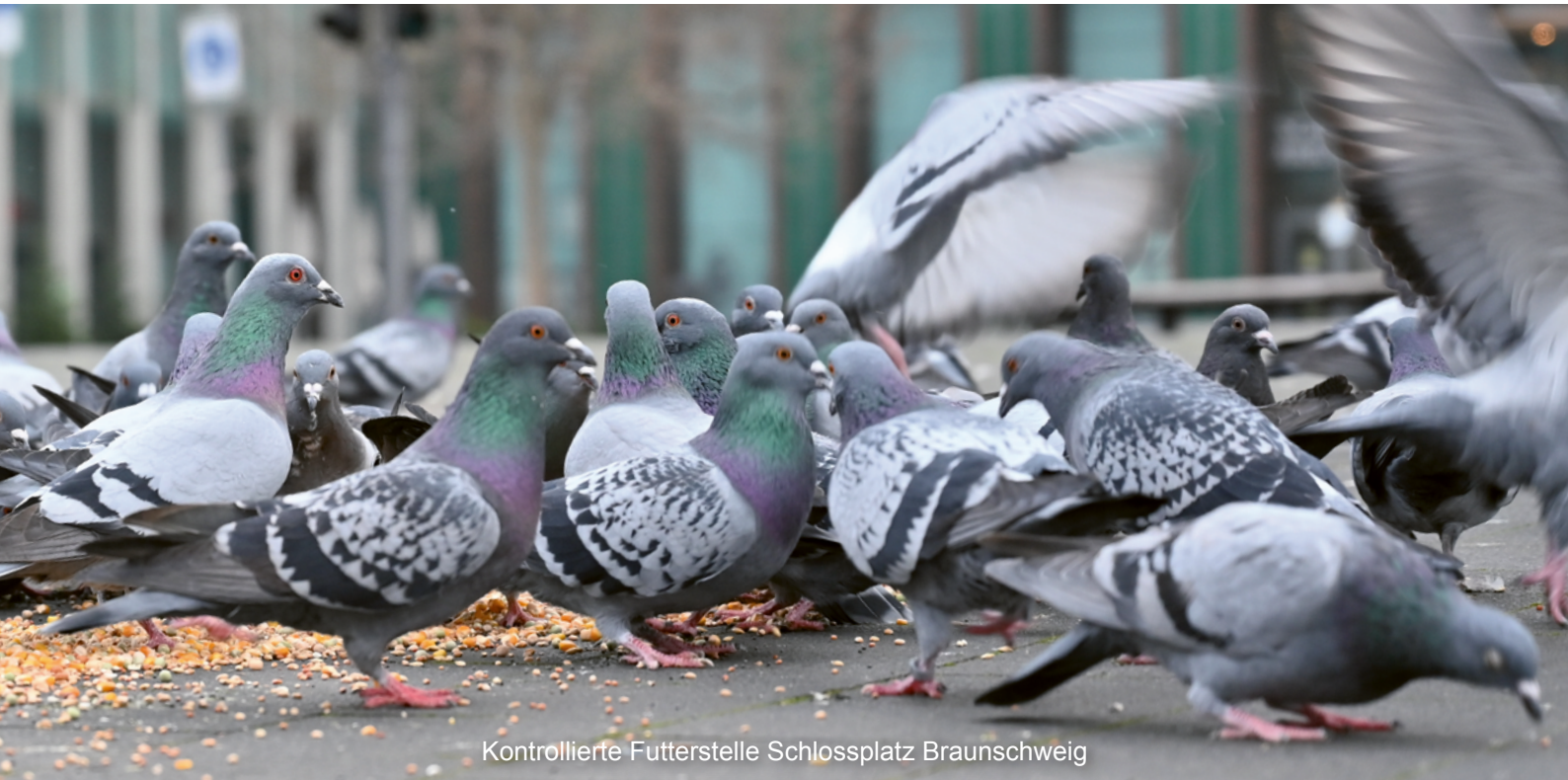
Kontrollierte Futterstelle Schlossplatz Braunschweig

Niedersächsisches Ministerium für Ernährung, Landwirtschaft und Verbraucherschutz