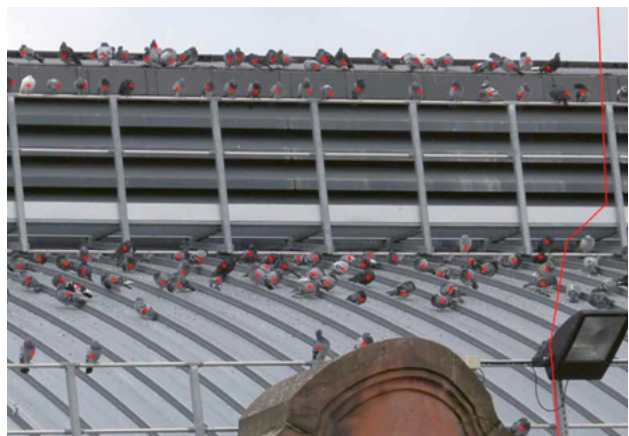
Beispiel einer Fotoauswertung (Ausschnitt)

Die Berechnung und Schätzung der Gesamtpopulation setzt sich aus den Zählwerten der untersuchten Brennpunkte einschließlich einer Dunkelziffer und Zählfehlerquote zusammen .